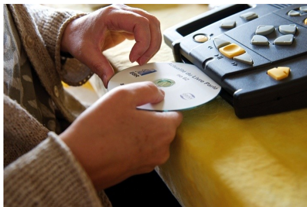
Utilisation d'un livre parlé avec lecteur adapté