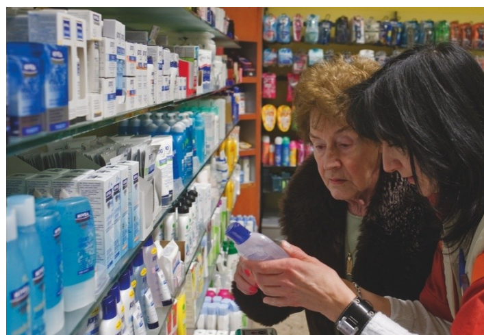
Retrouver les produits avec l'aide du personnel de vente

Soutenez notre action et faites un don CCP 12-872-1