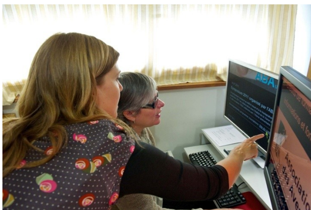
Réadaptation à domicile

Dans le Canton de Genève, l'ABA est l'association référente pour tout ce qui concerne la malvoyance et la cécité. Elle emploie une dizaine d'ergothérapeutes et six assistants sociaux qui se rendent à domicile, ainsi qu'une quinzaine de collaborateurs (dont des bibliothécaires, techniciens du son et transcriptrices braille) travaillant à la Bibliothèque Braille Romande et livre parlé. L'ABA gère également un EMS pour personnes aveugles ou malvoyantes: le foyer du Vallon.