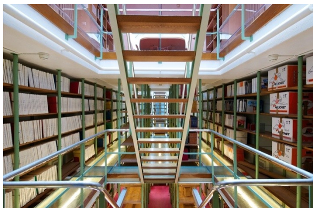
Intérieur de la Bibliothèque (BBR)

Pour tout renseignement et inscription, contactez le Service du Prêt de la BBR au 022.317.79.01 .