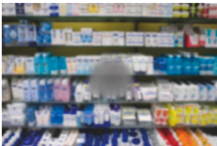
Simulation de DMLA, devant un rayon de grande surface

Par téléphone au 022.317.79.19 ou par mail : aba@abage.ch .